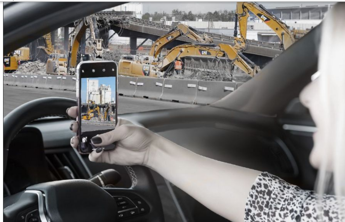
Photo takers are crash makers.